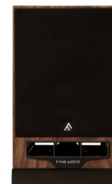
ナチュラル・ウォールナット w/グリル