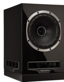
ピアノグロス・ブラック(PGB)