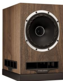
ナチュラル・ウォールナット(WN)