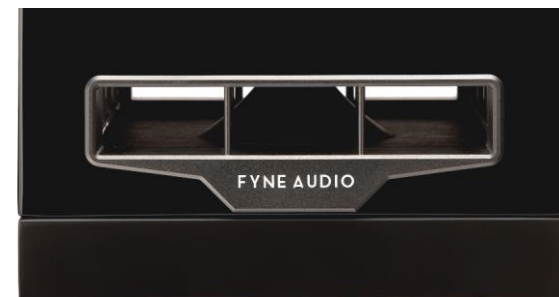
ベーストラックス・ディフューザー

F500S では、このディフューザーを分厚い台座にマウントし開口部はキャビネットと一体化させることで、安定性を高め、その威力をさらに強力なものとしています。