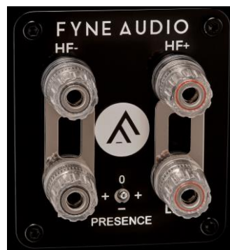
バイワイヤー端子とプレゼンスコントローラー